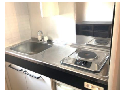
③ ミニキッチン （IHヒーター・コンセントあり）