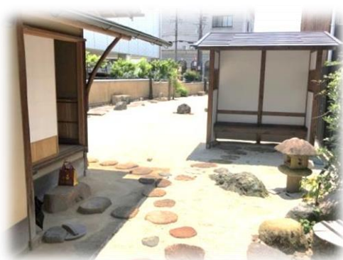
茶室横にある待合