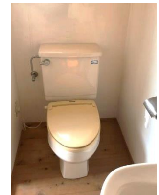
④ 洋式トイレ・手洗い場あり