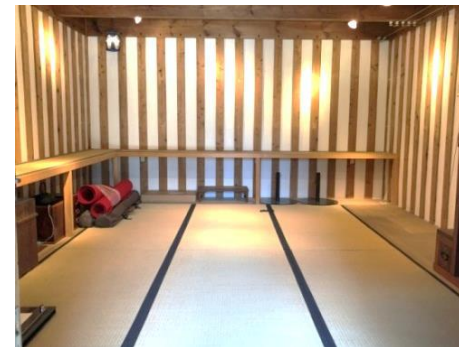
② 蔵内（展示用照明あり）