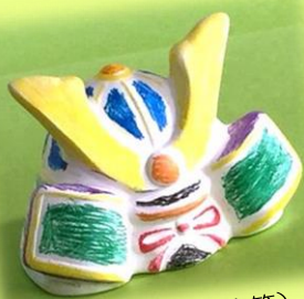
お絵かき兜 (貯金箱) クレヨン等でぬって、 その場でお持ち帰り!